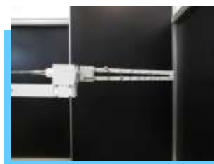
ログペリアンテナ 取付例