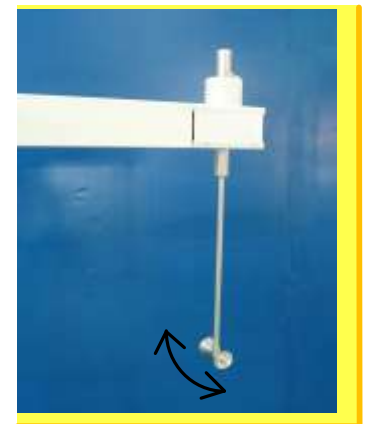
アンテナが下向きの場合