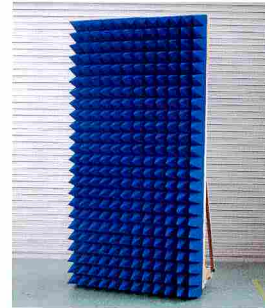
高さ 2.4m × 横 1.2m